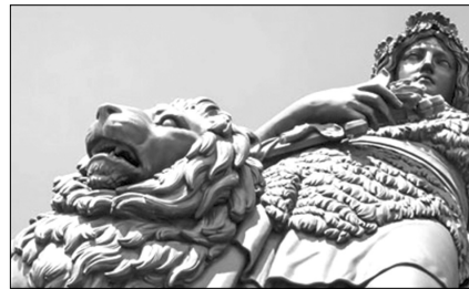
ВИДЕРТИСЯ НА «БАВАРІЮ»