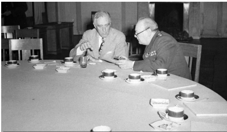
Франклін Рузвельт (ліворуч) і Вінстон Черчилль (праворуч) у Лівадійському палаці обговорюють деталі переговорів під час обідньої перерви, лютий 1945 року.

Вона приїхала разом з батьком з Москви за кілька днів до початку конференції на посаді протокольного офіцера. Сам Гарріман одразу ж поїхав на Мальту на зустріч Рузвельта і Черчилля, а Кетлін залишився займатися логістикою й облаштуванням американської резиденції. Вона мала підготувати кімнати для кожного делегата, врахувати, що Рузвельт прикутий до інвалідного візка, і подбати навіть про такі дрібниці, як правильне написання імен і посад у документах і на картках за обіднім столом. А вже навіть найдрібніший казус міг зашкодити переговорам. А траплялися вони постійно. Наприклад, у перший же день один з американських генералів залпом випив стакан місцевого бренді, який прийняв за фруктовий сік. Однак