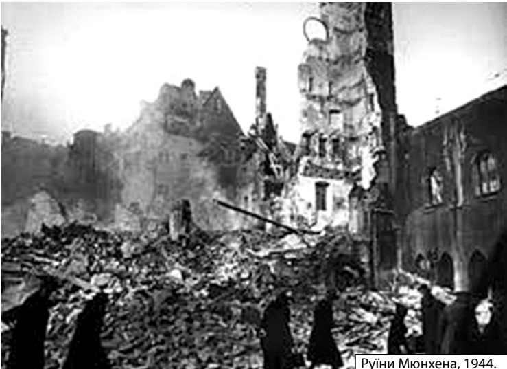
Руїни Мюнхена, 1944.

У Мюнхені видно було вже війну зблизка. Хоч збомбардованих дільниць ще не було, лиш тут чи там розвалена кам'яниця, а за нашої тут присутності взагалі налетів не було, алярм був кілька разів, бодай два рази, денно.