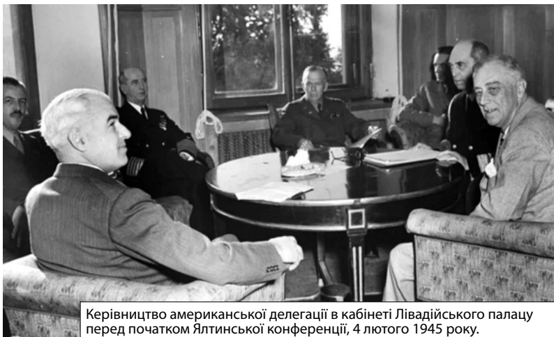
Керівництво американської делегації в кабінеті Лівадійського палацу перед початком Ялтинської конференції, 4 лютого 1945 року.