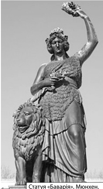
Статуя «Баварія», Мюнхен.

Барів та каварень було в місті повнісенько, з більше нами відвідуваних назву «Дінцеркеллер», кафе «Одеон», «Гофгартен кафе» та багато інших, зрештою спритні хлоп-