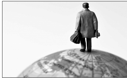
ПОЧАТИ З НУЛЯ