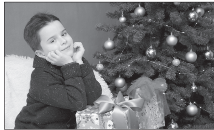
ПОДОРОЖ У ДИВО