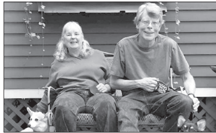
«ЗЕЛЕНИЙ СЛІД» 2 СІЧНЯ 1970-го