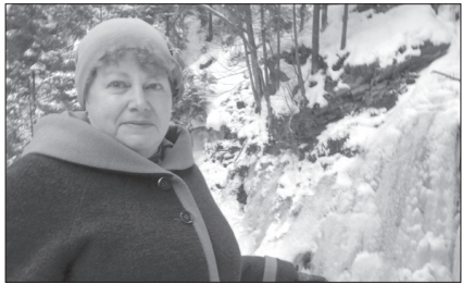
СЕРЙОЗНІ ПРОЄКТИ НЕ БОЯТЬСЯ КРИЗИ