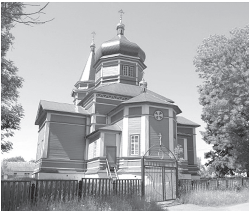
(Закінчення. Початок на стор.8)

Хата для священнослужителя на церковній присадибній землі облаштувалася ще в 1876 році стараннями парафіян та поміщика і була власністю церкви, але приміщення для священника тоді не добудували, через що для проживання воно було незручне. Інших будівель, які належали церкві, не було. 16 У відомості за 1883 рік йдеться, що церкві ще належав амбар. Серед документів, яку хронологічно вели священнослужителі, зберігався опис церковного майна за 1859 рік. Продовжували заповнювати