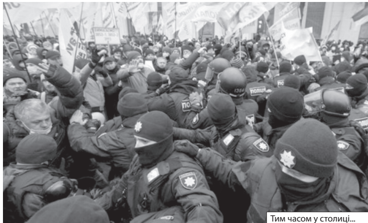
Тим часом у столиці...

Від тридцяти п'яти років і старші пластунки мають статус сеньйорів. Приємно було б почуватися сеньйорою, але я не належу до «Пласту». Та й ошадною пластункою мене сьогдні назвати не можна. Збірник афоризмів коштує стільки, скільки місяць мого користування електроенергією. У пору осіннього холоду, вогкості, загальної любові людей до тепла і ковбаси, у час підвищення цін інакше, як дивачкою, мене не назвеш.