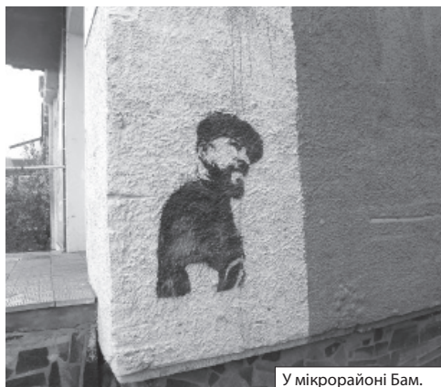
У мікрорайоні Бам.

Пам'ятники на вшанування героїв та жертв Другої світової мають лишатися в нашому міському чи сільському середовищі, в ландшафтах і архітектурно-скульптурних об'єктах, комплексах. Виховання патріотизму не буде ефективним лише у категоричному прояві знести все, що поставили комуністи. Тоді варто відмовитися і від батьків і дідів, які принесли користь своєю діяльністю для кожного з нас, а творили це в контексті більшовицької планової економіки і п'ятирічки?