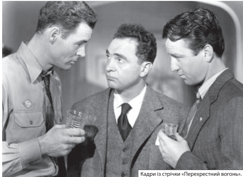
Кадри із стрічки «Перехресний вогонь».