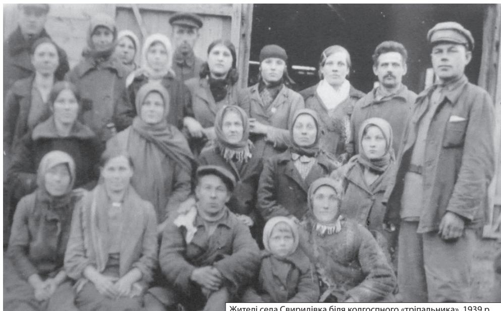
Жителі села Свирідівка біля колгоспного «тріпальника». 1939 р.