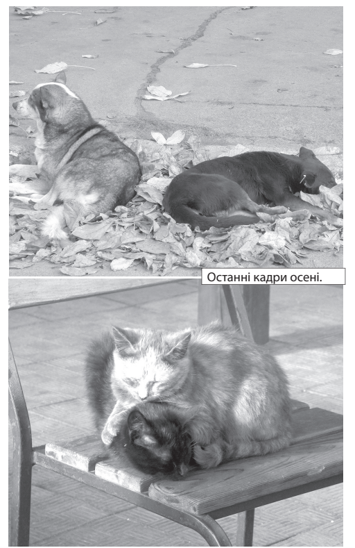
Останні кадри осені.